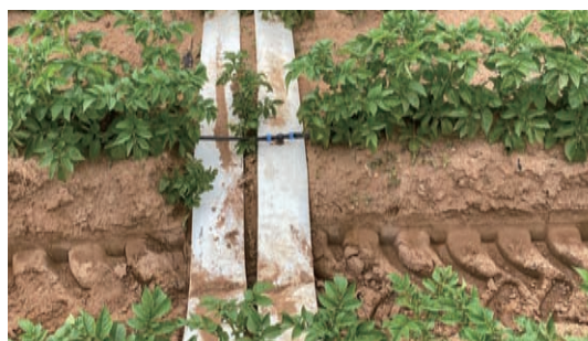
管道内不充水时，可承受一定程度的机械碾压