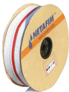
FlexNet™ HP 高压版